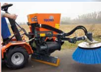
Mechanisch verstelbare zijborstel