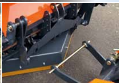
opnamesysteem voor Tuchel Trac Trio