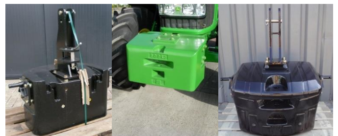
B 900 FENDT