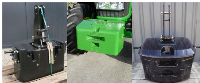
B 900 FENDT